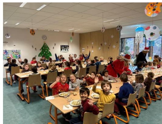
Repas de Noël

Nous avons poursuivi l'aménagement de la cour de l'école en installant des bacs à sable pour le plus grand plaisir des petits et des grands. Restant à l'écoute de l'équipe pédagogique nous avons pour projet d'installer une structure de 90 m2 dans la cour afin de protéger les enfants de la pluie et du soleil. Nous prévoyons une installation au printemps.