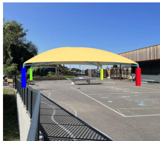
Structure de protection pluie et soleil