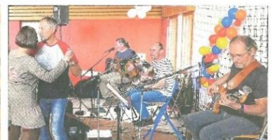
En première partie, c'est le groupe "Kernoe Trio" qui a entraîné le public sur la piste.

En première partie, c'est le groupe "Kernoe Trio" qui a entraîné le public sur la piste avec ses chants et musiques celtiques, laissant ensuite la place au concert de "Greens Field" et son répertoire de musique traditionnelle irlandaise.