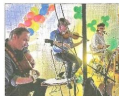
Le concert de "Greens Field" et son répertoire de musique traditionnelle irlandaise.

Samedi était organisé à la salle polyvalente de Pallud la fête de la Saint-Patrick, une coproduction de trois associations qui sont dans un même élan : créer de l'événementiel et promouvoir des artistes locaux.