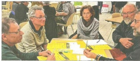
Chaque habitant qui se sent concerné est appelé à participer au débat.

Pour ne pas rester perdus en l'air, ces remarques se sont traduites ensuite en actions concrètes. Le mur de la salle a servi de tableau géant pour des "fi-